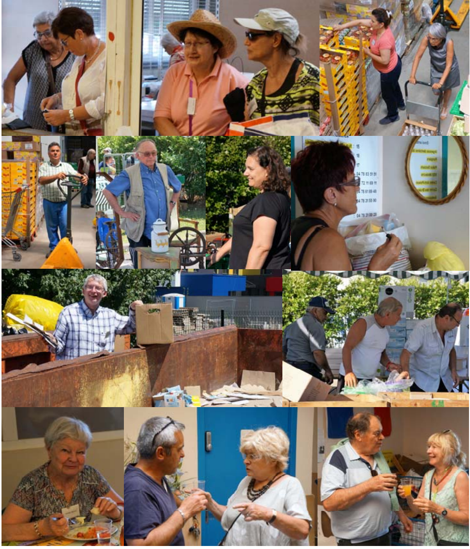
De gauche à droite et de haut en bas : application ; attention ; empilement ; conduite ; perplexité ; satisfaction ; interrogation ; évacuation ; imitation ; alimentation ; direction ; santé...